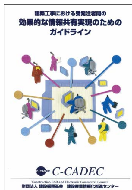
図 4-1 ガイドライン表紙

また、資料編として、用語集や参考文献一覧の他、「事前協議におけるチェックリスト」と「情報共有マニュアル（作成例）」を盛り込んでいる。