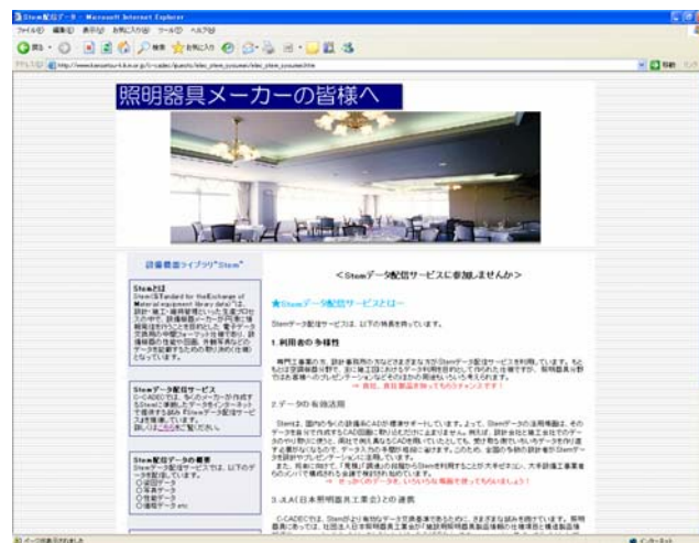
図 4-3 Stem 照明器具登録に向けた広報 HP

また、今まで C-CADEC が Stem に関して発信してきた情報・解説が、ともすれば硬く重苦しい内容と誤解されかねない面があったため、照明器具メーカーに対してデータ提供を求めるホ