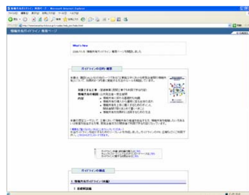
図4-1 ガイドライン専用HP

については、同サイト内にデータをダウンロード可能な状態で公開し、実務での利活用に便を供した。