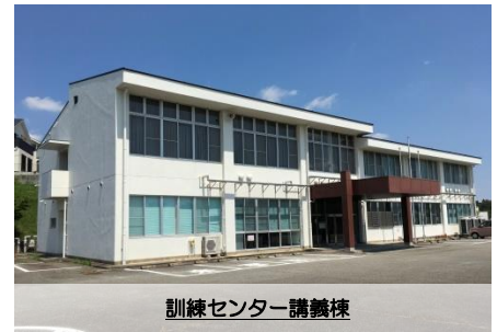
訓練センター講義棟